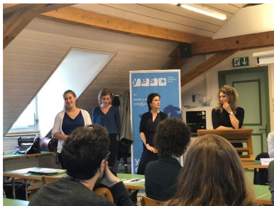
Table ronde à l'Université de Fribourg

En collaboration avec l'Université de Fribourg et foraus, la yes a organisé une table ronde bilingue sur les élections européennes le 21 mai. Plus de 40 personnes ont suivi le débat passionnant entre